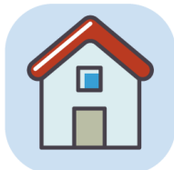
які стосуються житлових і комунальних питань