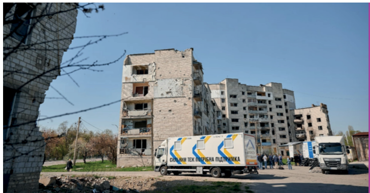
Офіційне відкриття Урядом України та UNFPA, за підтримки Іспанії та Бельгії, трьох мобільних центрів допомоги врятованим для підтримки людей, постраждалих внаслідок війни, включно з постраждалими від СНПК, – Бородянка, Київська область, Україна, квітень 2024 року.

У квітні 2024 року було офіційно запущено три мобільні центри допомоги врятованим, які працюють у Київській, Чернігівській, Сумській, Харківській та Херсонській областях, що наближає підтримку до місцевих громад та дозволяє мешканцям районів, які більше не перебувають під російською окупацією, а також у прифронтових регіонах отримувати якісну психологічну, соціальну, та юридичну підтримку. З 2022 по 2025 рік послугами, що надаються мережею, скористалися майже 60 000 українців, які постраждали від конфлікту, включно з постраждалими від #СНПК. Визнаючи ефективність пілотної моделі реагування, Уряд затвердив Постанову про Примірне положення про центр допомоги врятованим, з 43 тим щоб громади могли самостійно створювати такі центри відповідно до норм цього Положення.