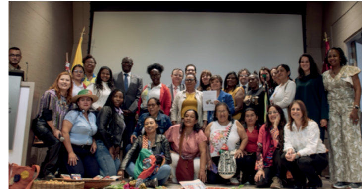
Учасники процесу Справи 05 СЮПМ під час паралельного заходу, організованого GSF та Університетом Росаріо, Богота, Колумбія, у листопаді 2024 року.